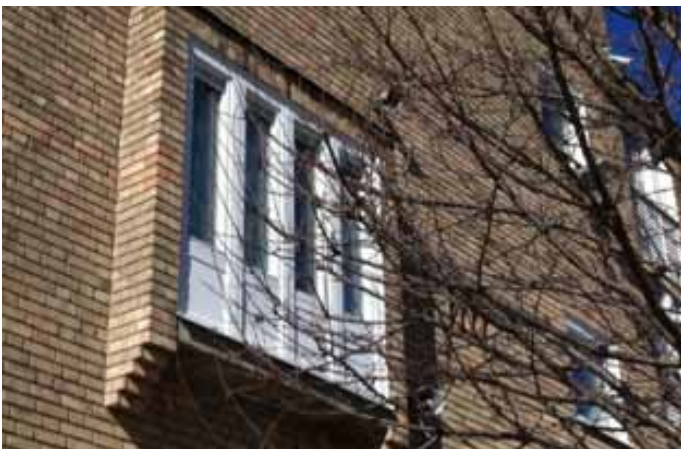
8. Utbyggd för uppsyn och med lur för gehör. (burspråk på Årstaskolan).....