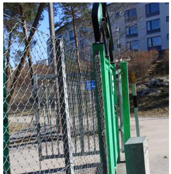
11. Staket med grind ju vanligt är, men vart leder just den här? (Årsta Idrottsplats).....