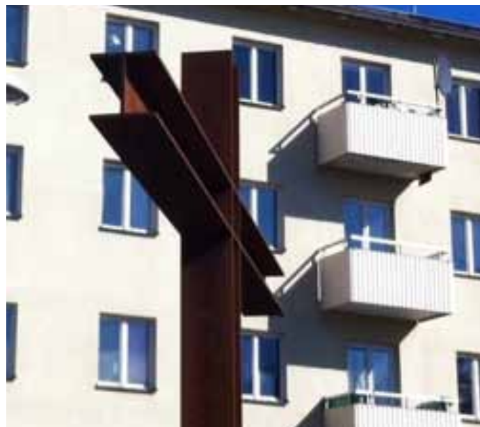
3. Många små ettor för kvinnor i landets första loftgångshus. (EPA-huset, Bränningevägen 9 eller 17).....