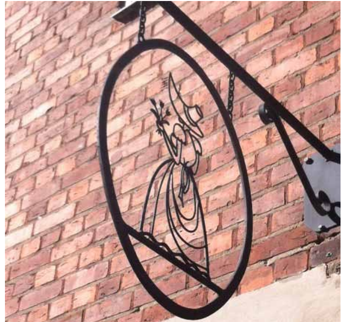
6. Världigt kokett med sin bundna bukett (Hjälmarsvägen 30).....