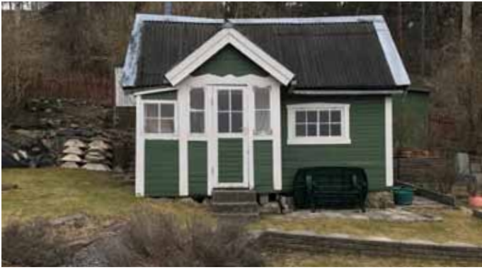
5. I skogen ett småstugemyller, som 100 just nu fyller. (Dianelunds koloniområde).....