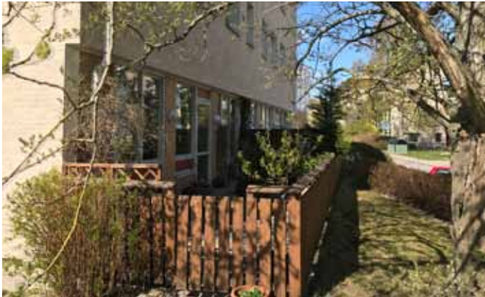
7. Konsumbutiker i varje knut - nu de alla till annat bytts ut. (fd Konsumbutik, Slätbaksvägen 30).....