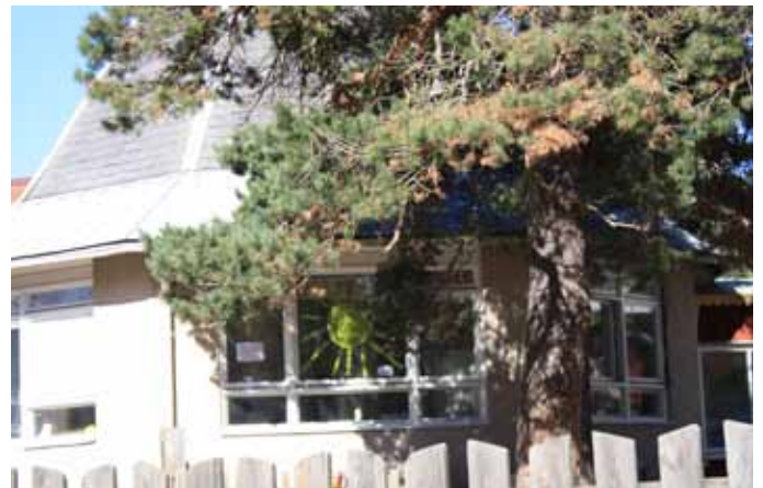
10. Märklig byggnad för de unga, kanske kan man också gunga. (Kolsnarsvägen - förskolan).....